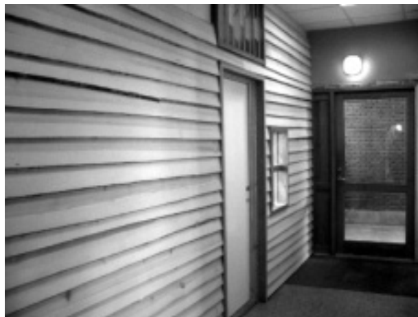
Nederst ses facaden til det nye rum opbygget som en bjælkehytte.