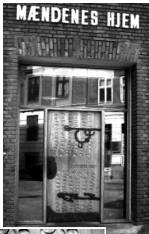
Nedest den nye egetræsdoor med udskæringer.