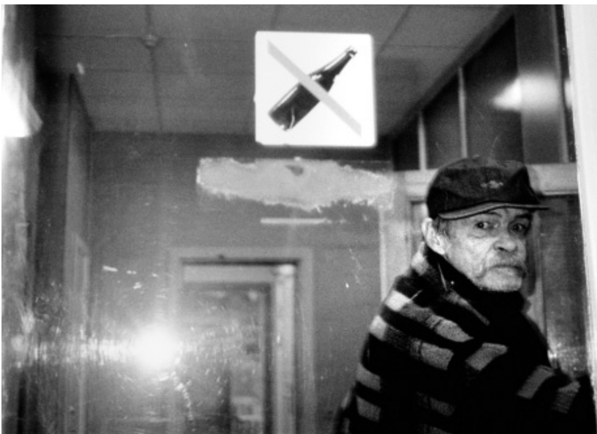
Mændenes Hjem ved nattetid.

Mange steder er delt op efter forskellige paragraffer, så tilbud efter Servicelovens § 94, § 91 og § 88 i dag udgør en bredere vifte end tidligere. Det er selvfølgelig en udløber af ændret lovgivning og nye centrale initiativer som for eksempel "skæve boliger" til mennesker, der har svært ved at finde sig til rette i de "almindelige" boligområder, og alternative plejehjem til ældre misbrugende hjemløse. Det mest iøjenfaldende eksempel på omstrukturering er de ændringer, som er sket i København, hvor Sundholm er nedlagt som centralt forsorgshjem, og der er etableret flere decentrale boformer.