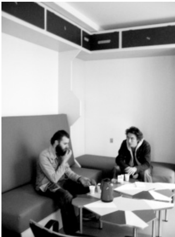
Den gamle reception, nu ombygget til observations/sove- og samtalerum.

Vi har for eksempel holdt workshops, som ikke kun har benyttet sig af den verbale