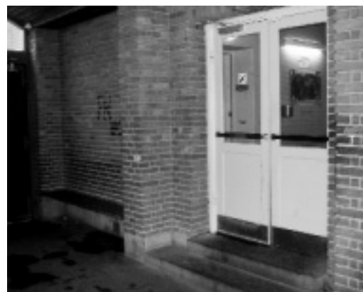
Øverst det gamle indgangsparti.

Vi ønsker at skabe en tryk platform for den udstødtes ellers meget ustabile og kaotiske liv. Den skabes ikke blot via tillid og hjælp fra personalet, men også i det