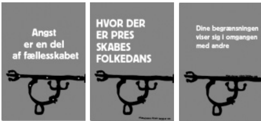
Plakater fra ombygningsprocessen udarbejdet af kunstnerne Kenneth Ballfelt og FOS.